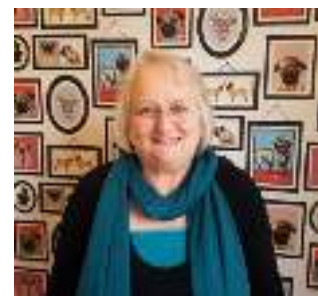
Oficial de Finanzas