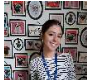
Asistente de Marketing