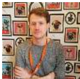
Director de Actividades