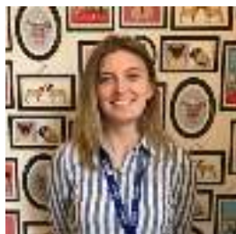
Asistente de Ventas