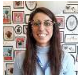
Responsable de alojamiento