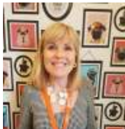
Responsable del bienestar de la escuela