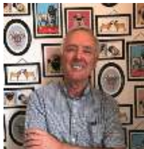
Director de Estudios